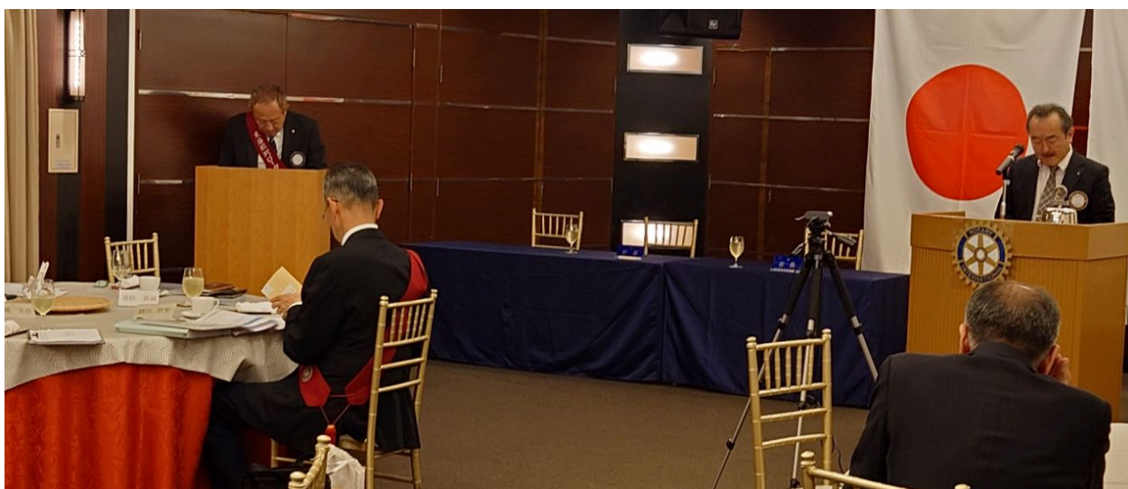
クラブ協議会開催風景(2)