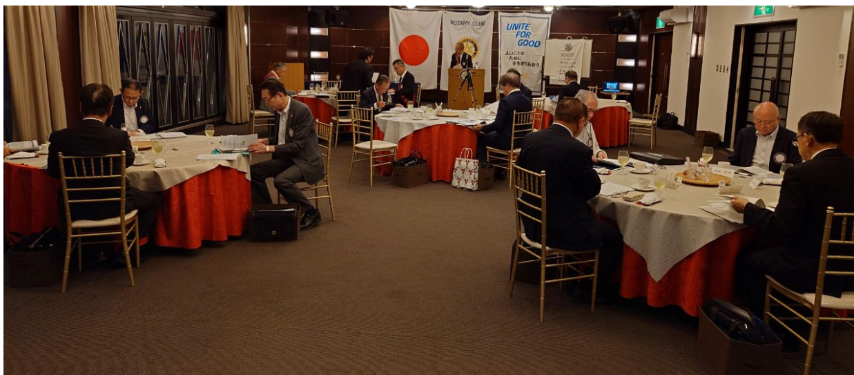
クラブ協議会開催風景(1)

今期(2025-2026年度)各委員会から一年間の事業報告を行うとともに質疑応答を行いました。