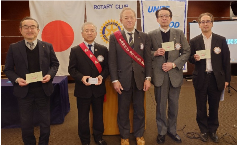
会員及びご夫人お誕生日祝