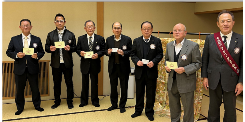
会員誕生日及びご夫人誕生日の皆さん