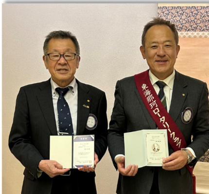
米山功労賞の厚見会員と猪股会長