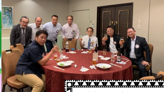
皆様いい顔してますね～