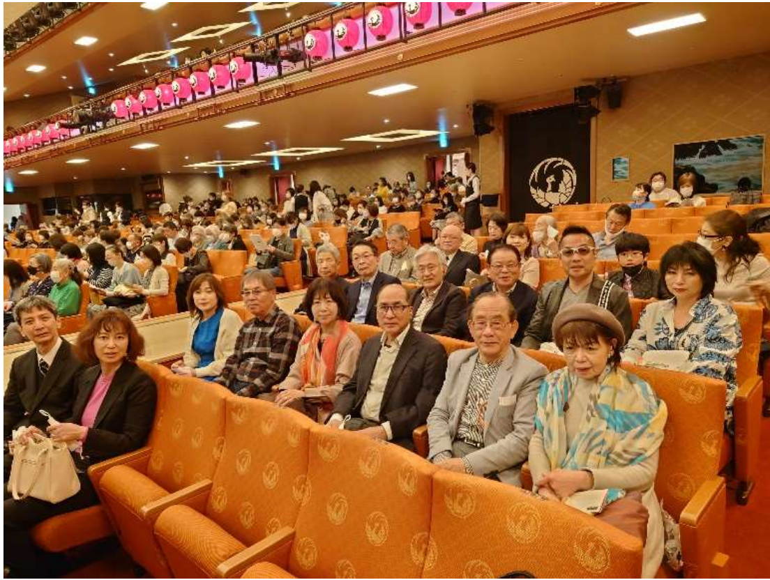
歌舞伎座 公演前風景