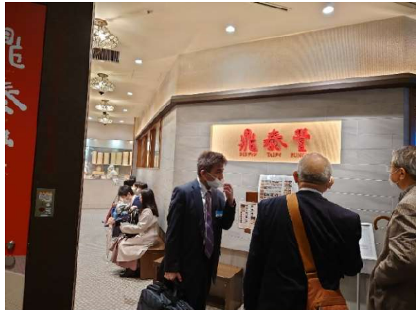
夕食 鼎泰豊(ティンタイフォン)入口