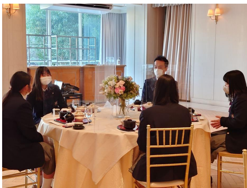
インターアクトクラブの生徒さんと顧問の先生