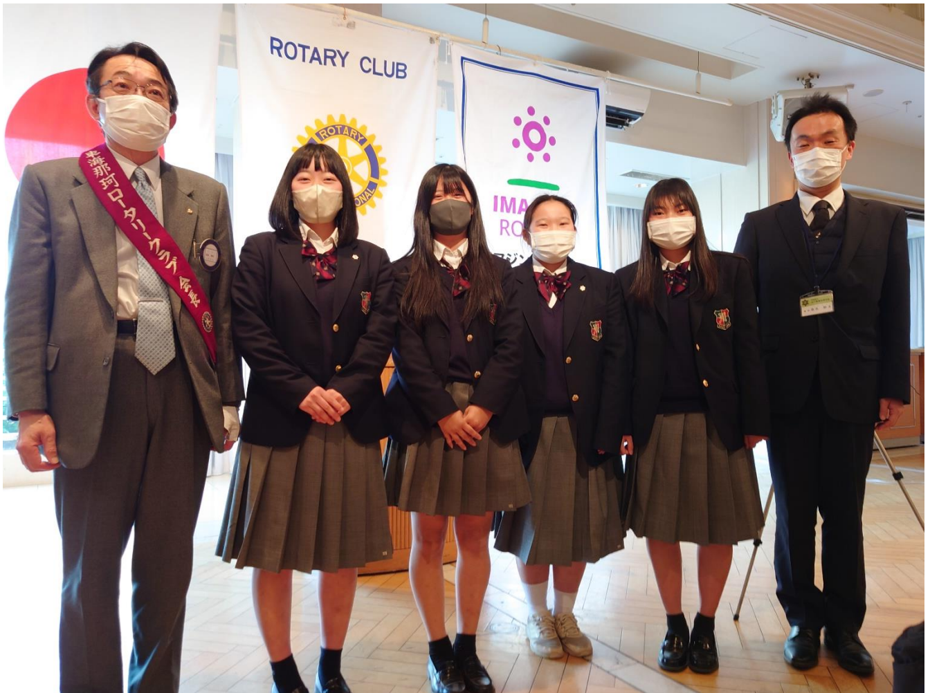
本日の例会に参加したインターアクトクラブの皆さま