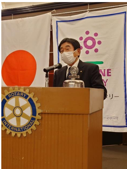
植野親睦活動委員長挨拶