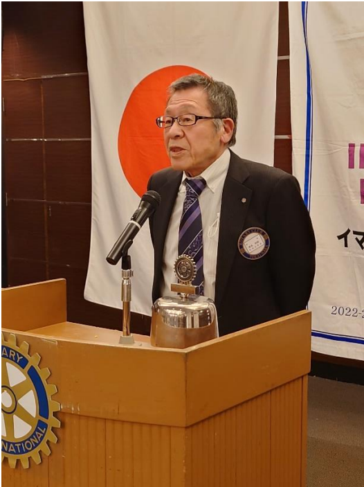
厚見幹事 閉会の挨拶