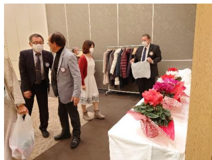
ご夫人方にお花のプレゼント