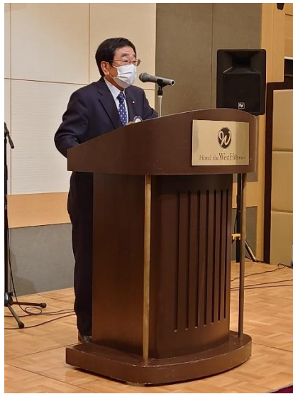
植野親睦活動委員長挨拶