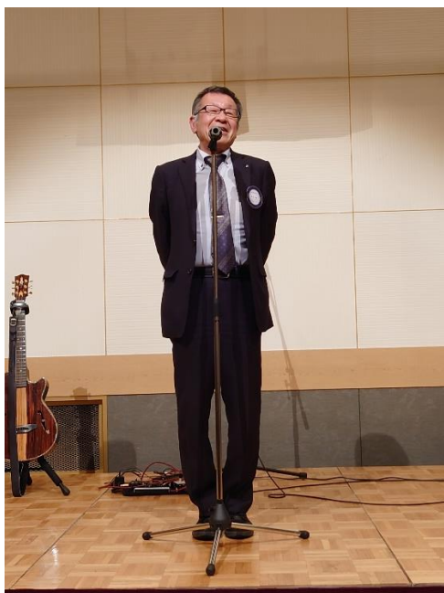
厚見幹事 閉会の挨拶