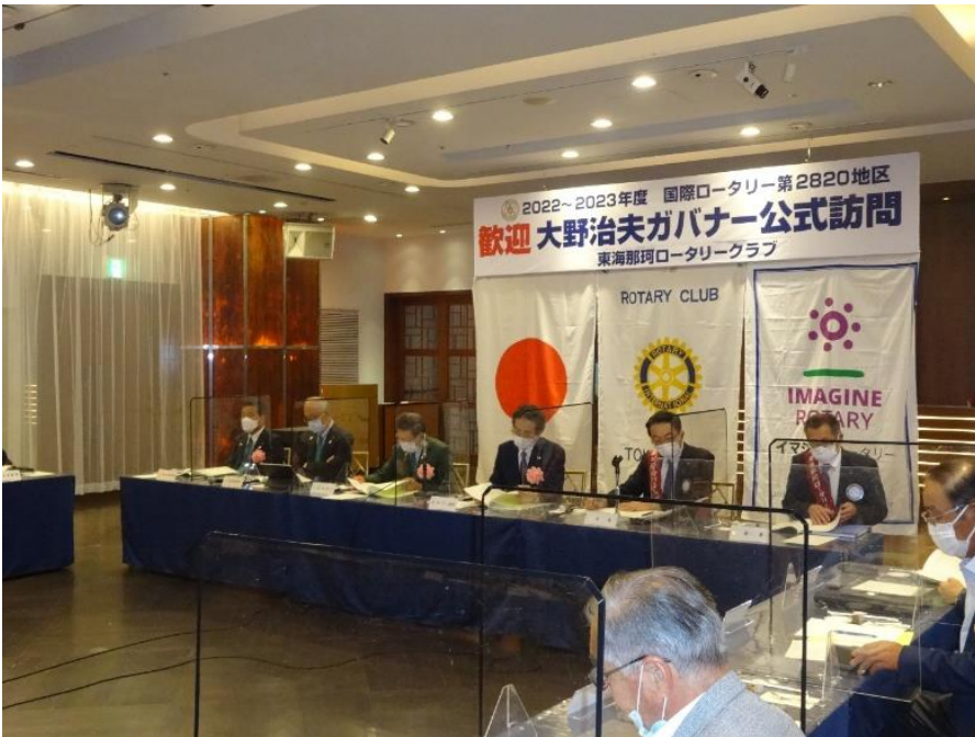
正面ガバナーテーブル