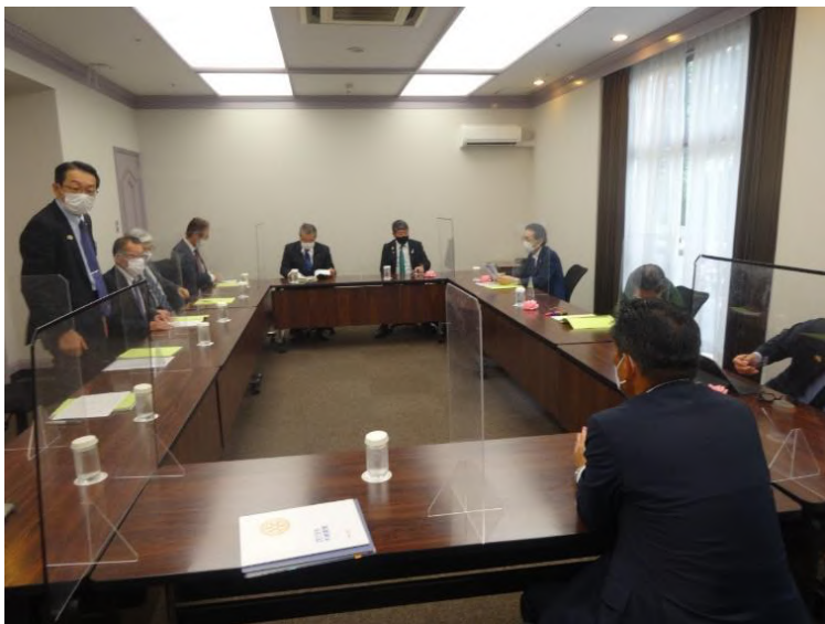
事前協議会会場全体