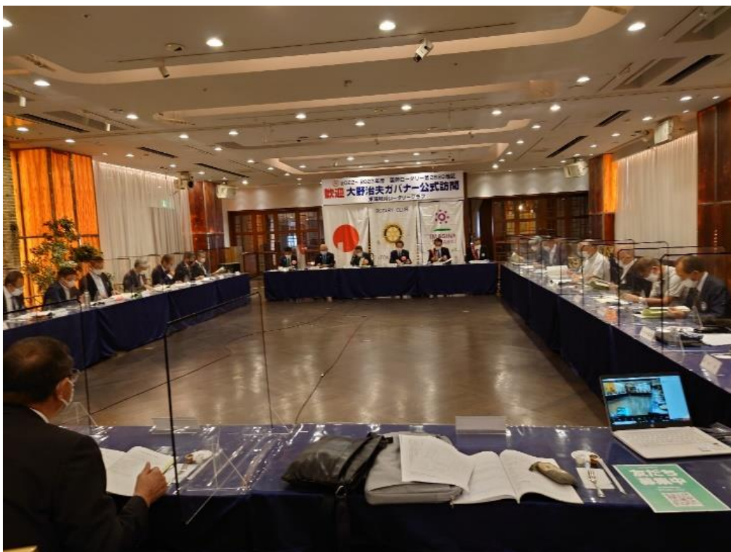
クラブ協議会会場全体