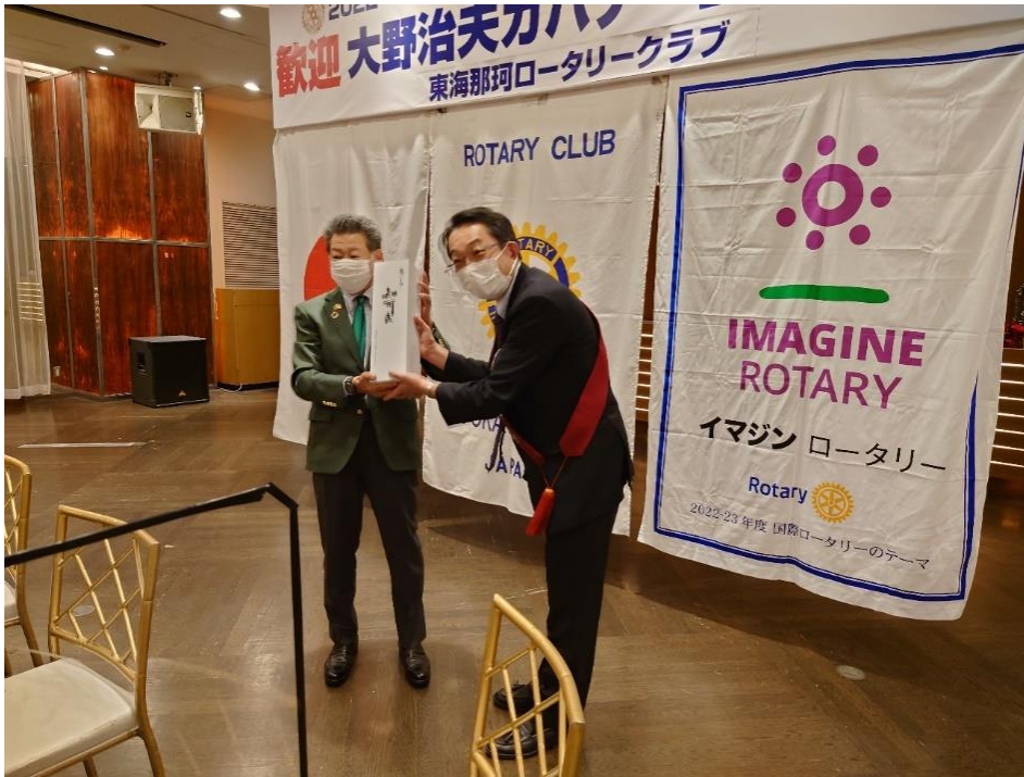
ガバナーよりクラブへのプレゼント