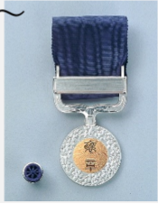
内閣府ホームページより