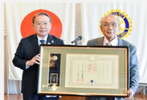
2021年7月6日 上野RC例会場にて