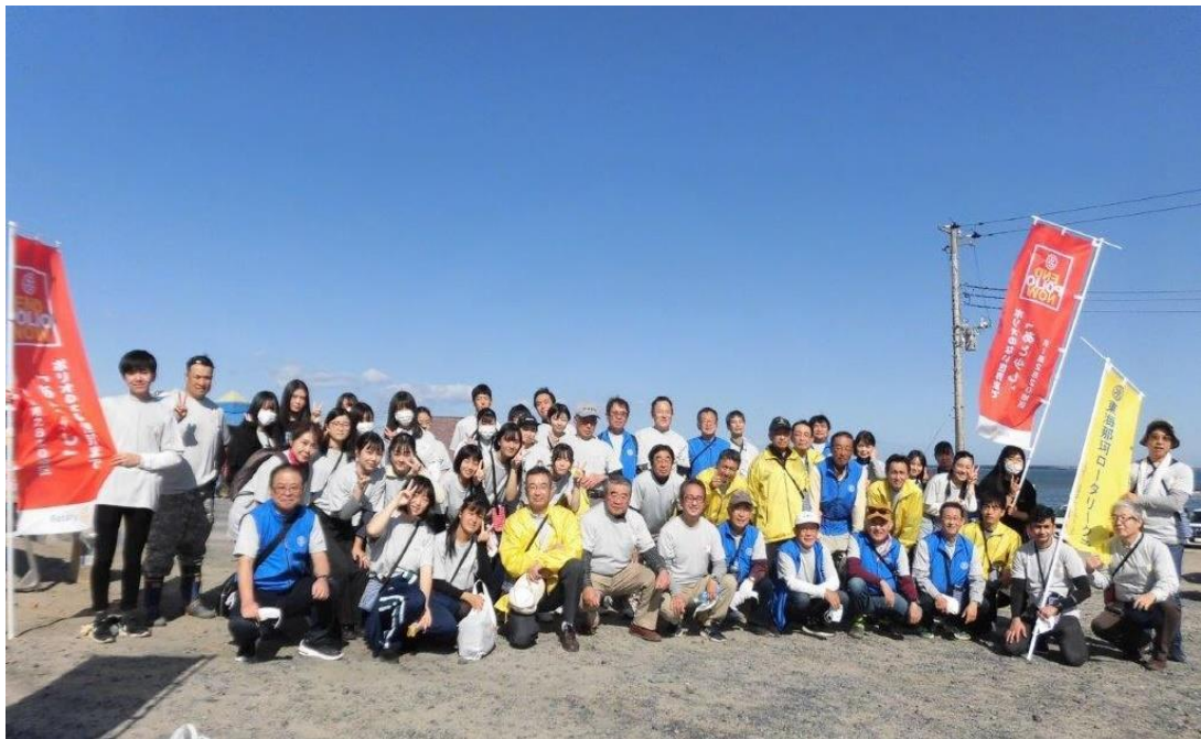
茨城海岸美化プロジェクトに参加した東海那珂ロータリークラブの関係者