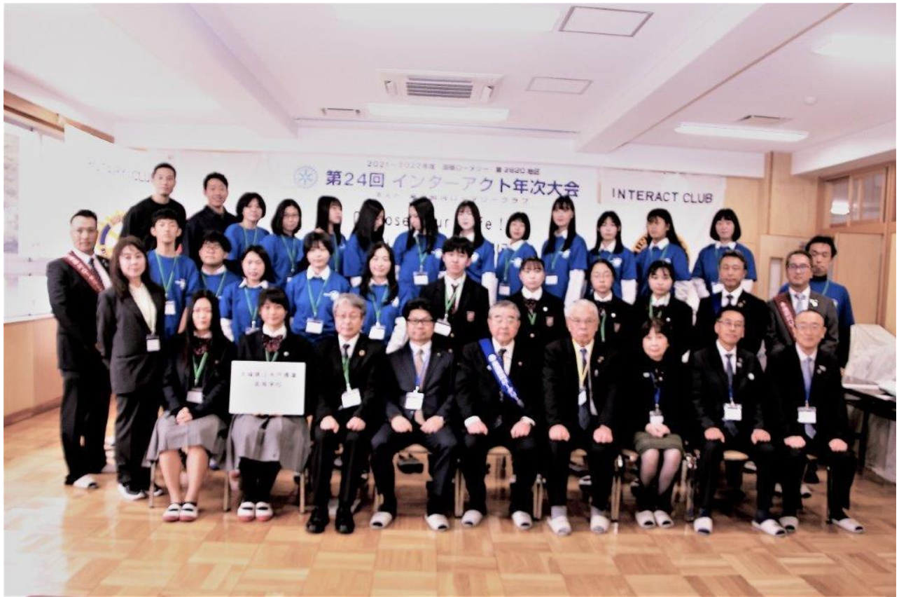
水戸農業高等学校生とロータリアン