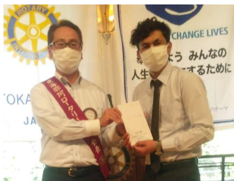
米山記念奨学会から奨学金授与